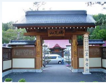
第32・33番札所／置戸・弘法寺

北海道八十八ヶ所霊場は、北の大地北海道をお遍路する霊場です。その行程は、およそ3,000km。観光と合わせて巡礼する方も多くいらっしゃいます。緑の大地、日本最北・最大の霊場をお参りませんか！