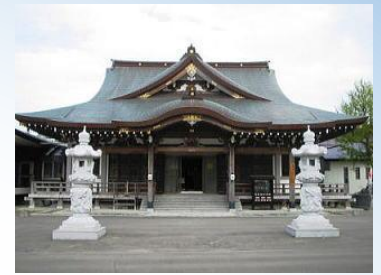
第47・48番札所／大樹・高野山寺