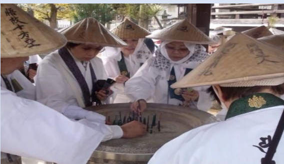
⑥お線香をお供えする。 Point 後から立てる方のために、香炉の中央から立てる。 本堂、及び大師堂において3本ずつ立てる。