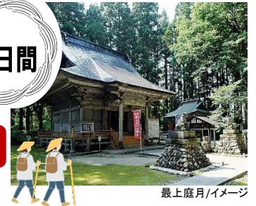
最上庭月/イメージ

「朝」朝という字は十月十日と書く。今日一日新しい命をいただく。明日を生きている保証などない。だから一生懸命今日を生きる。