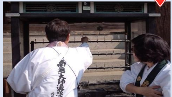
⑤ローソクをお供えする。 Point 後から立てる方のために上の段から立てる。 Point 本堂及び大師堂において1本ずつ立てる。