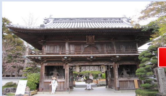
②札所（お寺）には必ず山門があります。