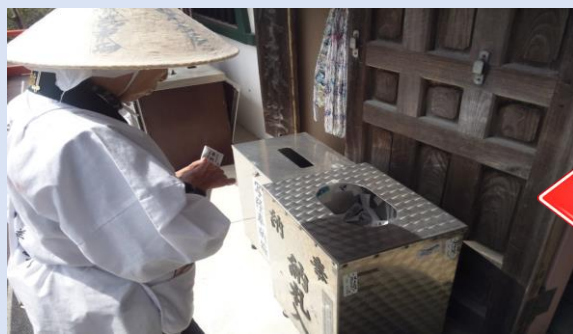
⑦納札を本堂及び大師堂で1枚ずつ納める。 写経を準備された方は写経も納める。