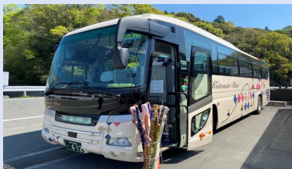
①バスが札所に到着