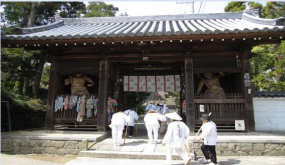
③山門で一礼して境内に入ります。