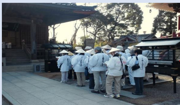
③先達を中心に全員でお経を唱える。 本堂、大師堂の向かって右または左側に整列し、お経を唱える。