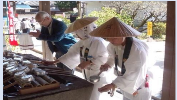
④洗手堂にて手と口を清める。 Point 柄杓を直接口につけないこと。 Point 手に水を取って口に含みすぐ。