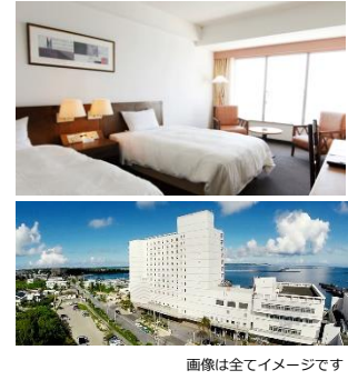
画像は全てイメージです

※ご搭乗便の発着時刻・便名、ゴルフのスタート時間 (送迎がある場合の送迎時間) は変更となる場合がございます